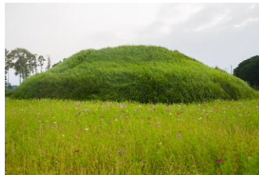
C [ ]