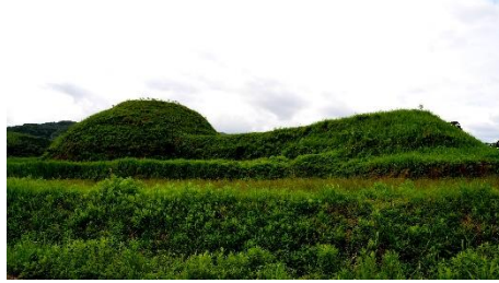
A [ ]

問題 19 下記の写真は新原・奴山古墳群に含まれる墳丘の写真である。これらの墳丘の形状を漢字で答えよ。