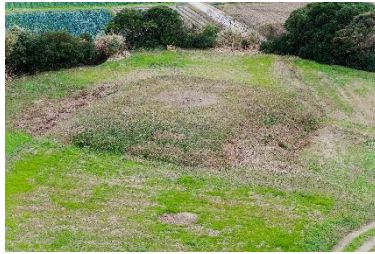
B [ ]