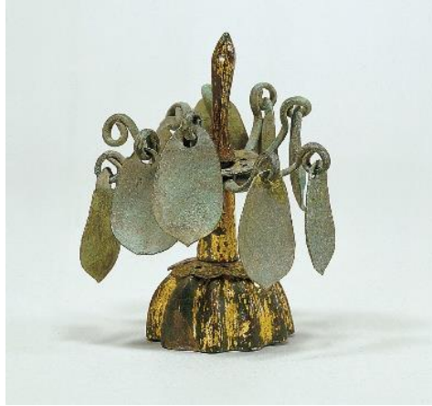
金銅製歩揺付〔 雲珠（うず） 〕