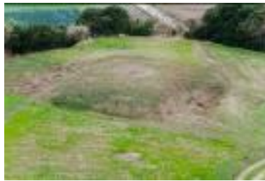
B [ 方墳 ]