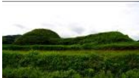
A [ 前方後円墳 ]

下記の写真は新原・奴山古墳群に含まれる墳丘の写真である。これらの墳丘の形状を漢字で答えよ。