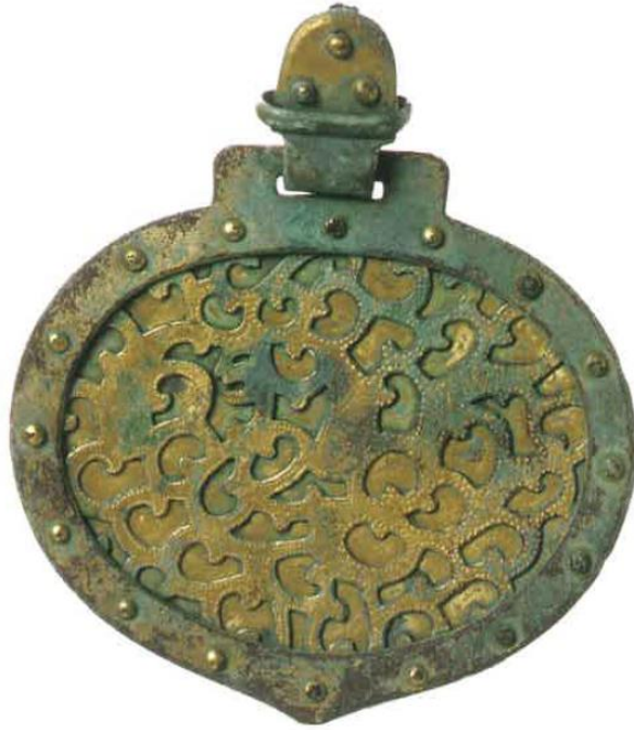
金銅製心葉形〔 杏葉 〕

問題 25 下記の写真で示した沖ノ島から出土した奉獻品の名称の一部を漢字で答えよ。