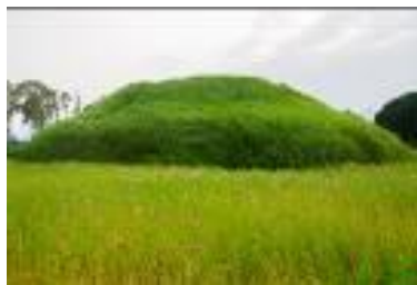
C [ 円墳 ]